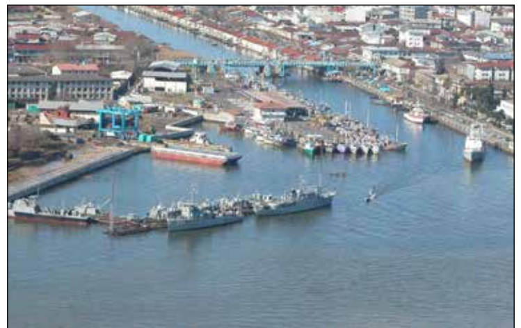
صادرات غیرنفتی در دو ماهه ابتدای سال جاری از گمرکات استان گیلان ۸۴ درصد رشد داشته است.

مدیرکل گمرک انزلی اظهار داشت: در همین مدت ۲۶۳ هزار و ۸۴۸ تن کالا به ارزش ۱۷۲ میلیون و ۷۸۲ هزار و ۷۹۴ دلار شامل انواع آهن‌آلات و ماشین‌آلات صنعتی، لوازم برقی و