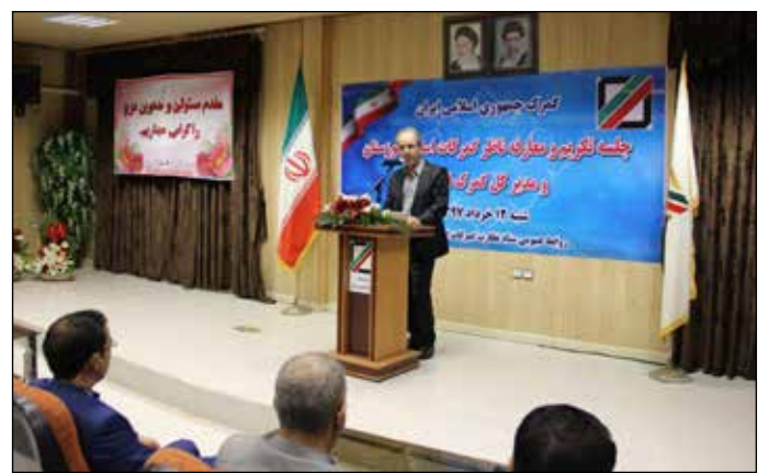
استان خوزستان ظرفیت‌های خوبی دارد و گمرکات خوزستان از مزیت‌های ویژه‌ای برخوردار است.

بحرینی بیان کرد: گمرک خوزستان با برنامه‌ریزی