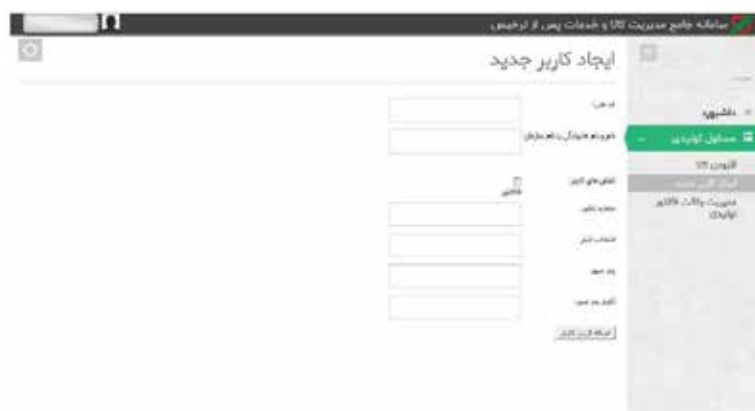
عکس ۵- ایجاد کاربر جدید توسط مسئول تولیدی

در هر زمانی که بخواهید به هر دلیل از جمله تغییر مسئولیت کارمندان، اتمام مدت زمان همکاری با کارمندان و... دسترسی فاکتور را از کارمندان خود بگیرید می‌توانید از طریق منوی مدیریت وکالت فاکتور نسبت به گرفتن وکالت داده شده اقدام نمایید.