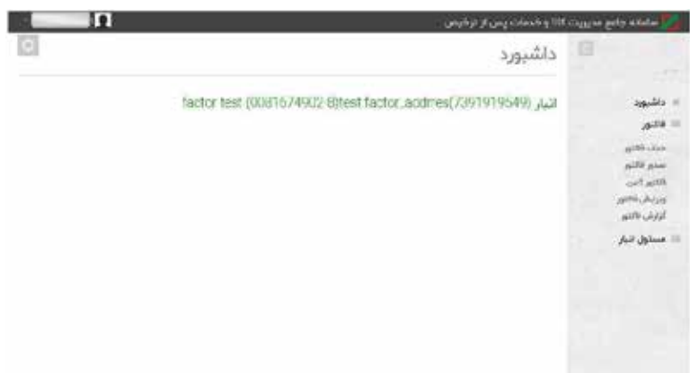
عکس ۹- زیر منوهای تب فاکتور