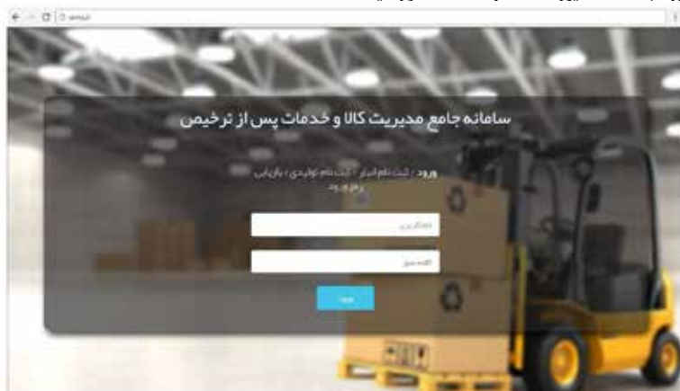
عکس ۷- ورود به صفحه کارمند تولیدی

هر یک از کارمندان که در سامانه دسترسی کاربری و همچنین وکالت فاکتور را دارا باشند می‌توانند وارد سامانه شده و از طریق منوی فاکتور نسبت به صدور فاکتور و... اقدام نمایند. پس از ورود به سامانه این صفحه را مشاهده می‌کنید: