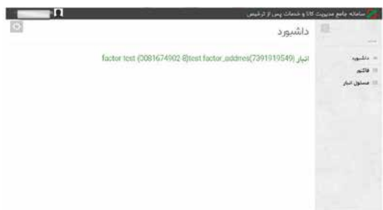
عکس ۸- داشبورد دسترسی کارمند تولیدی