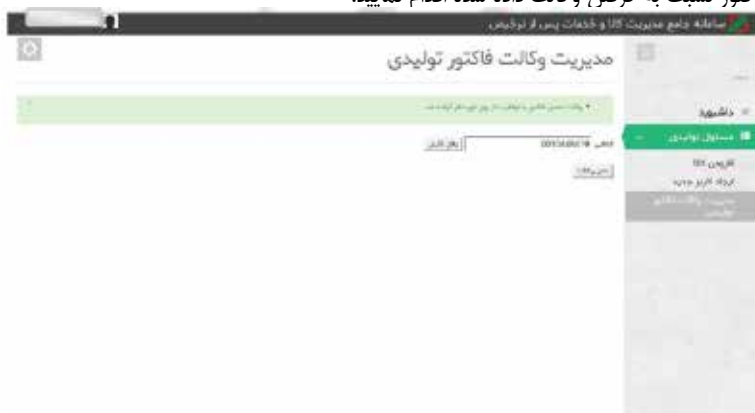
عکس ۶- گرفتن دسترسی از کارمند توسط مسئول تولیدی

در هر زمانی که بخواهید به هر دلیل از جمله تغییر مسئولیت کارمندان، اتمام مدت زمان همکاری با کارمندان و... دسترسی فاکتور را از کارمندان خود بگیرید می‌توانید از طریق منوی مدیریت وکالت فاکتور نسبت به گرفتن وکالت داده شده اقدام نمایید.