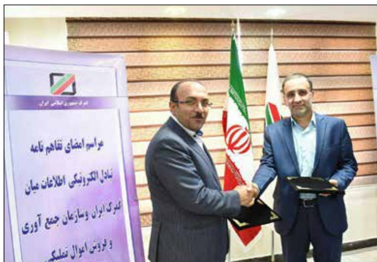
قانون امور گمرکی.

۹-۴- ارسال اطلاعات مربوط به تسویه حساب انبارهای خصوصی نگهدارنده کالاها