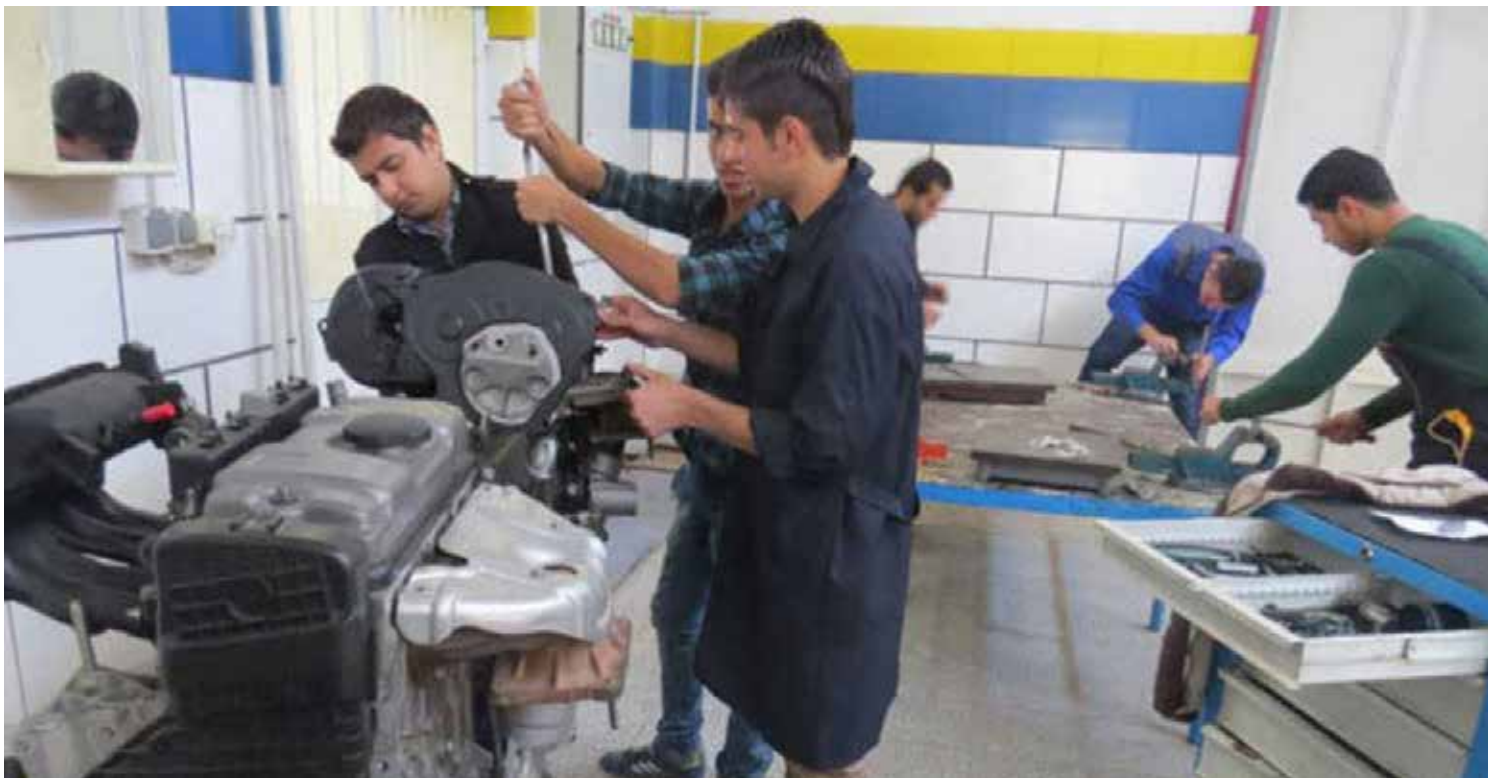
رئیس کل گمرک ایران: