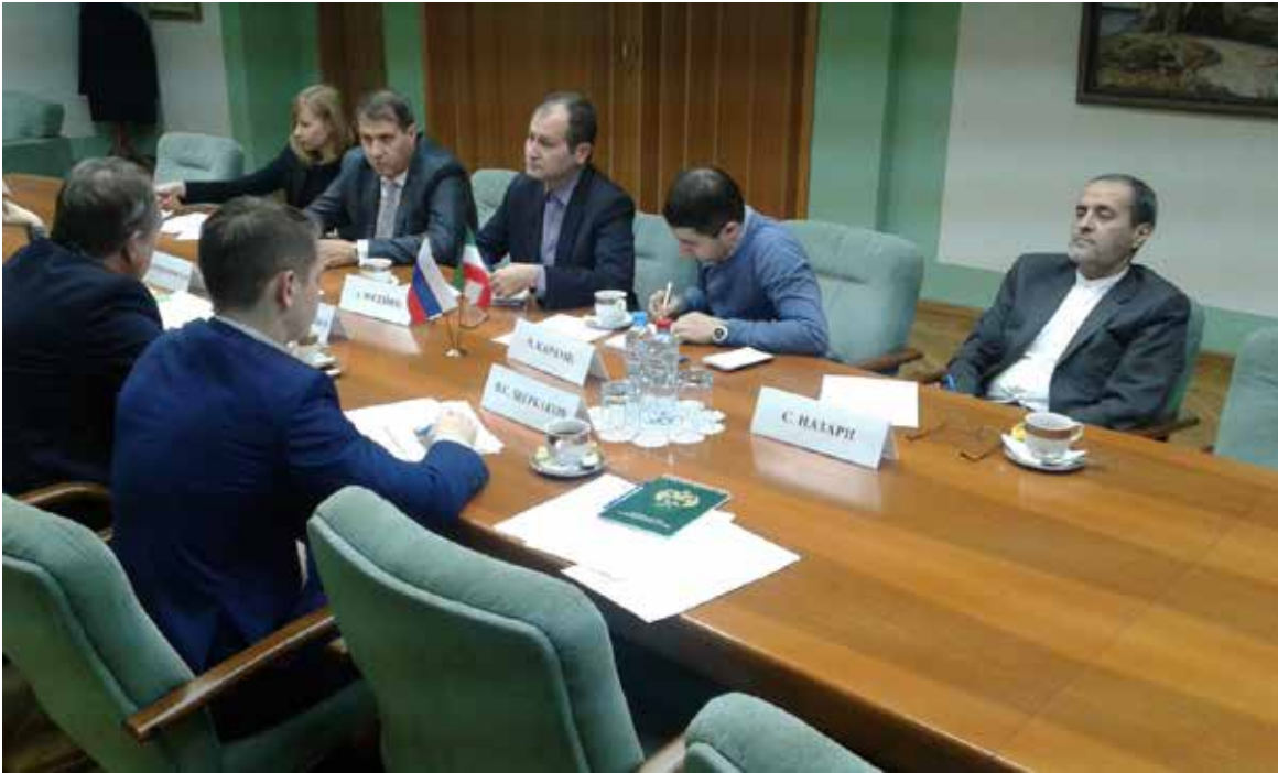
دیدار نماینده گمرک و نماینده سفارت ایران با مقامات گمرک و اتاق بازرگانی روسیه در مسکو

افزایش مناسبات ایران و روسیه این گزارش حاکی است مقامات شرکت کننده در این کنفرانس ابراز امیدواری کردند که با توجه به زمینه‌ها و شرایط مساعد فعلی حجم تعاملات اقتصادی، تجاری و دانشگاهی بین ایران و منطقه قفقاز شمالی به تبع آن سهم مناسبات بین مناطق ایران و روسیه افزایش یابد. ایران و قفقاز از طریق گرجستان و بندر ماخاچ قلعه مرکز جمهوری داغستان روسیه به یکدیگر متصل می‌شوند. لازم به ذکر است که در حاشیه این کنفرانس نمایندگان شرکت‌های ایرانی و روسی برای معرفی تولیدات و خدمات خود در جلسه‌ای با حضور نمایندگان سازمان‌های دولتی دو کشور دیدار و گفت‌وگو کردند.