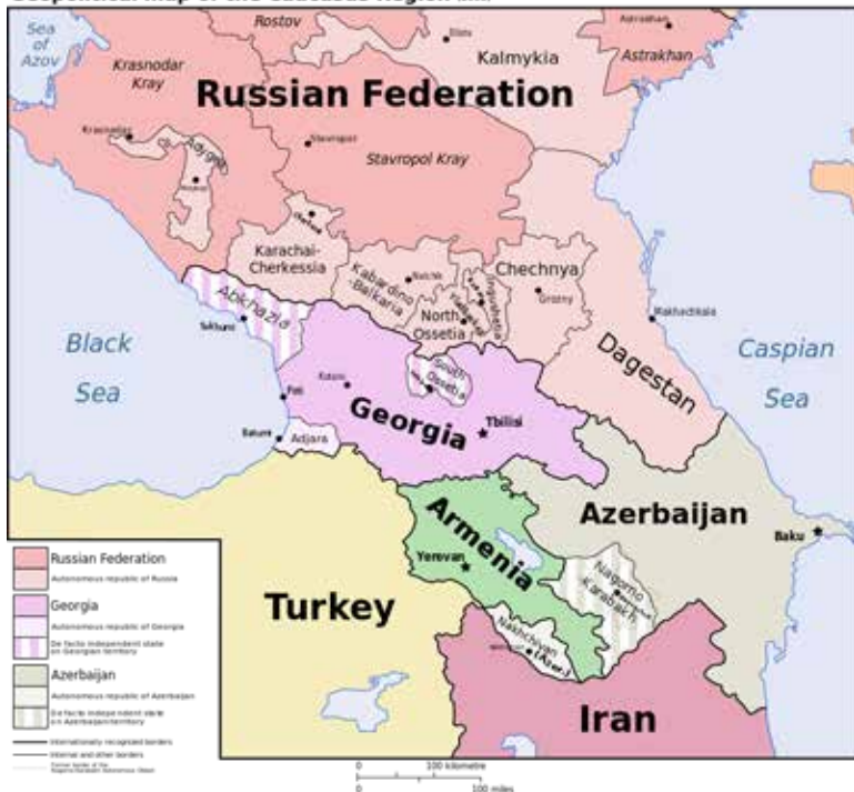
Geopolitical map of the Caucasus Region (2008)