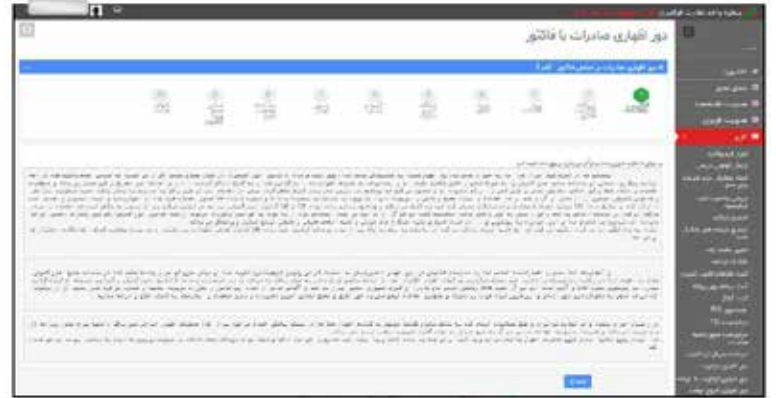
عکس ۱۹- دور اظهار صادرات یا فاکتور