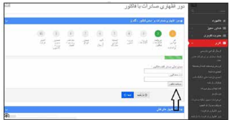
عکس ۲۰- فراخوانی شناسه فاکتور

با وارد کردن شناسه ملی صادرکننده فاکتور که همان صاحب کالای صادراتی خواهد بود و همچنین شماره فاکتور اطلاعات فاکتور فراخوانی خواهد شد: