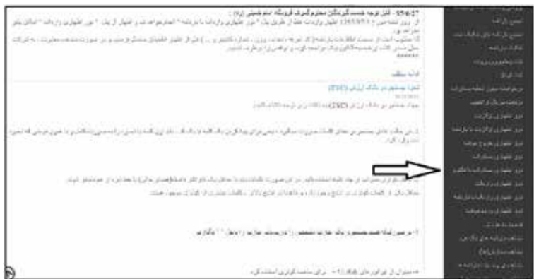
عکس ۱۸- اظهار صادرات با فاکتور

پس از انتخاب گزینه دور اظهاری صادرات با فاکتور و قبول قوانین عمومی تجارت برون مرزی می‌توانید نسبت به دریافت اطلاعات فاکتور از سامانه WMS.IR از طریق وب سرویس اقدام نمایید.