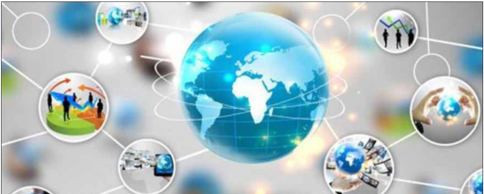
عکس ۱۶- epl.irica.ir

پس از انتخاب گزینه دور اظهاری صادرات با فاکتور و قبول قوانین عمومی تجارت برون مرزی می‌توانید نسبت به دریافت اطلاعات فاکتور از سامانه WMS.IR از طریق وب سرویس اقدام نمایید.