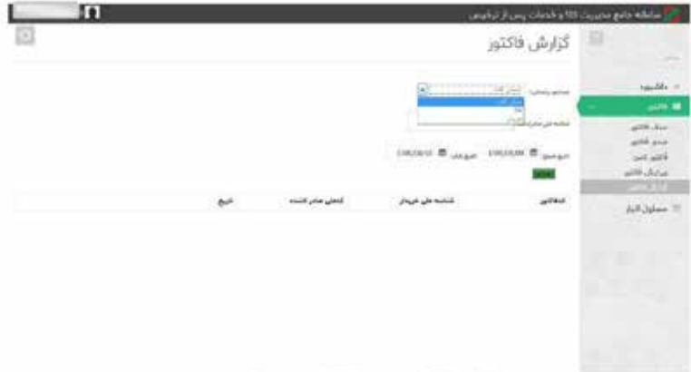
عکس ۱۵- دریافت گزارش فاکتورهای صادر شده

امکان گزارش‌گیری براساس صادرکننده، خریدار و کالا در بازه‌های زمانی مورد نظر وجود دارد.