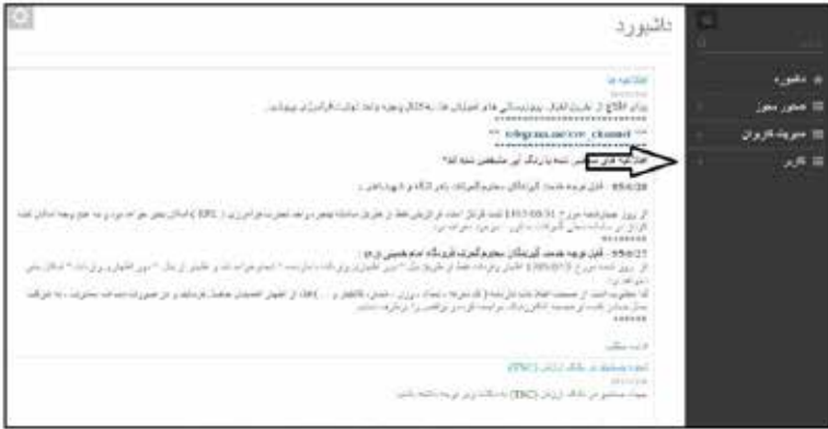
عکس ۱۷- داشبورد سامانه پنجره واحد