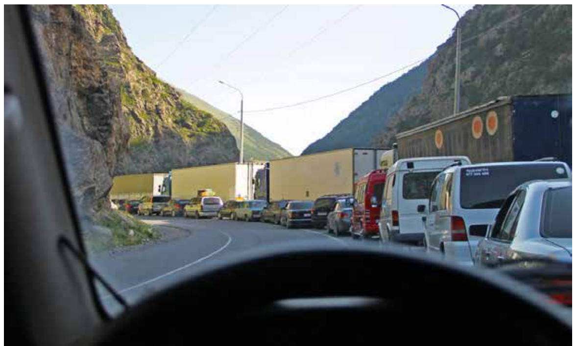
صف کامیون‌های خروجی از روسیه به گرجستان از طریق گمرک ورخنی لارس روسیه

می‌کند و متعلق به بخش خصوصی است وجود دارد. این نوع ترمینال در جمهوری اوستیای شمالی اولین و در ناحیه قفقاز شمالی دومین ترمینال است که از مرز ۱۰ کیلومتر و از ایستگاه راه‌آهن ۲۵ کیلومتر فاصله دارد. تعداد ۲۰ نفر کارمند گمرک در این ترمینال مستقر و سیستم کامپیوتری آن به گمرک متصل بوده و فرآیند ترخیص را در دو یا سه ساعت انجام می‌دهند. واردکنندگان روسیه یا صادرکنندگان سایر کشورها و شرکت‌های حمل‌ونقل می‌توانند از خدمات این ترمینال استفاده کنند. محموله‌ها تحت رویه ترانزیت داخلی می‌تواند به این ترمینال انتقال یابد و نیز می‌تواند به مدت ۴ ماه در این ترمینال انبار شود و طبق مقررات گمرک روسیه